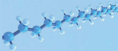
Molekularstruktur des PTFE

Die Polymerkette enthält nur die Elemente Kohlenstoff, Sauerstoff und Fluor. Ein typisches Krytox™ Öl enthält 21,6 Gewichtsprozent Kohlenstoff, 9,4 Gewichtsprozent Sauerstoff und 69,0 Gewichtsprozent Fluor.