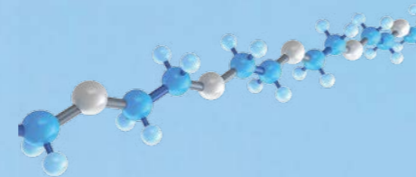
Molekularstruktur des PFPE

Die außergewöhnlichen Produkteigenschaften der Krytox™ Produkte basieren auf der besonderen molekularen Struktur von PFPE und PTFE. Die PFPE- und PTFE-Moleküle bestehen aus einer so genannten „abgeschirmten“ Polymerkette, das heißt, dass die Molekülkette vollständig gesättigt ist und nur sehr schwer chemische Reaktionen eingeht.